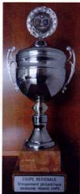
Coupe régionale Bourgogne Franche-Comté