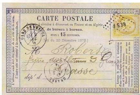
Précurseur, avec cachet rayé de la gare de Vesoul et ambulante Besançon-Paris (BES P)

Sans le savoir, nous avons parmi nous de nombreux deltiologues. Nous connaissons la cartophilie qui, comme le nom l'indique, concerne ceux qui aiment les cartes, sous-entendu les cartes postales. Le cartophile aime pour son simple plaisir, met de côté les cartes postales qu'il reçoit ou celles qu'il achète lors de ses promenades et pérégrinations. Eventuellement, il les classe et les range dans un album, soin que nos ancêtres ne manquaient pas de respecter, au temps où la photographie n'était pas encore démocratisée. Au mieux, il éprouve une stimulation, une excitation et même une jouissance à compléter sa collection et à la consulter et pourquoi pas du plaisir et de la fierté à la montrer à son entourage et à l'exposer en public.