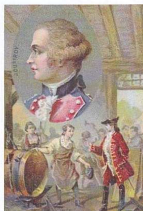
Jouffroy d'Abbans chez le chaudronnier de Baume-les-Dames

C'est donc au mois de mai que nous pourrons commencer à penser à la Fête du Timbre d'octobre qui est envisagée à Saint-Vit. Nous aurons tout le temps d'y penser mais préparez déjà vos collections à exposer en compétition ; vous avez presque un an pour mener votre travail à bien. Bon courage !