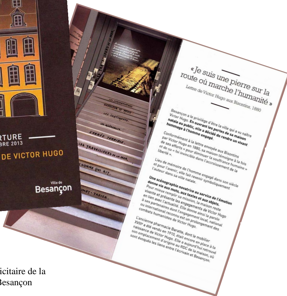
Feuillet publicitaire de la ville de Besançon