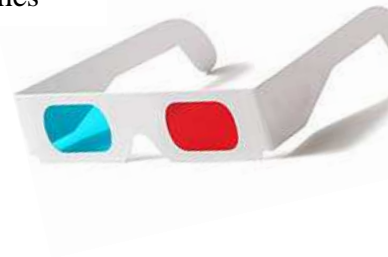
Carte postale 3D et lunettes anaglyphes