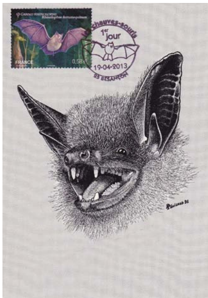
Grand Murin (Myotis myotis)