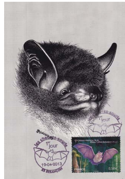
Vespertilion de Daubenton (Myotis daubentoni)